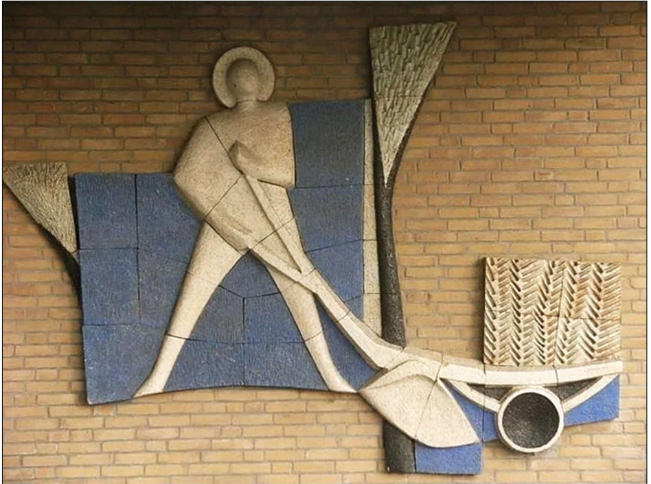
Reliëf met Isidorus op de buitenmuur van Museum Nagele (voormalige RK kerk).