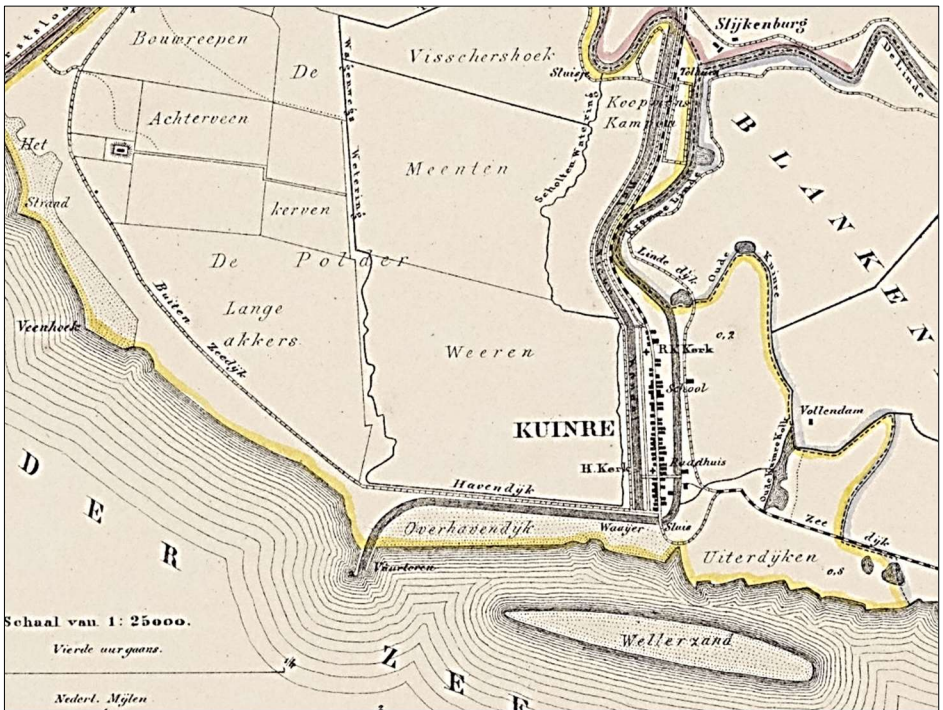
Uitsnede uit kaart Gemeente Kuinre 1865 van J. Kuijper; uitgave H. Suringar te Leeuwarden 1867. Onderaan het Wellerzand en links daarvan de Vuurtoren, een ietwat grootse naam voor het Havenlicht.

Kuinre lag aan de Zuiderzee en had door de rivieren de Linde en de Kuunder/Tjonger goede verbindingen met het Overijsselse en Friese achterland. In de twaalfde eeuw werd het Kuinderdiep gegraven, als kortere verbinding naar de zee. Handel en scheepsbouw ontwikkelden zich. Schepen konden echter niet aanmeren en moesten op de rede voor Kuinre blijven liggen. Lichters brachten de handel van en naar de schepen. Al eeuwenlang had Kuinre last van zandplaten voor de kust. De naam Wellerzand op de gemeentekaart van 1867 is bewaard gebleven in de Verzorgingsplaats (parkeerplaats en tankstation) langs de A16 in de Noordoostpolder.