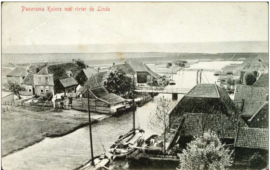
Panorama van Kuinre met rivier de Linde.

Een aantal straatnamen in Kuinre herinnert aan zijn scheepvaartverleden. Oudtijds had Kuinre geen haven, maar een rede of aanlegplaats buiten de kust. Tussen Sleep en Sasplein duidt het bordje met de naam Beurtmaskaai op de beurtvaart op Kampen, Zwolle, Sneek, Enkhuizen en Amsterdam. Van een veer op Enkhuizen is al sprake in 1659 (Oude Archieven Kuinre nr. 209). Voor de boterhandel hadden Kuinderse commissionairs (tussenhandelaren) zelfs een vaste standplaats op de markt te Amsterdam. In 1725 verklaart Arnent Arents Krul, dat hij alle schade, voortvloeiende uit de te grote hoogte van het nieuwe veerschip op Amsterdam, voor zijn rekening zal nemen (OAK nr. 200, met foutief de naam Arnet Arnets Krul; het betreft een kofschip).